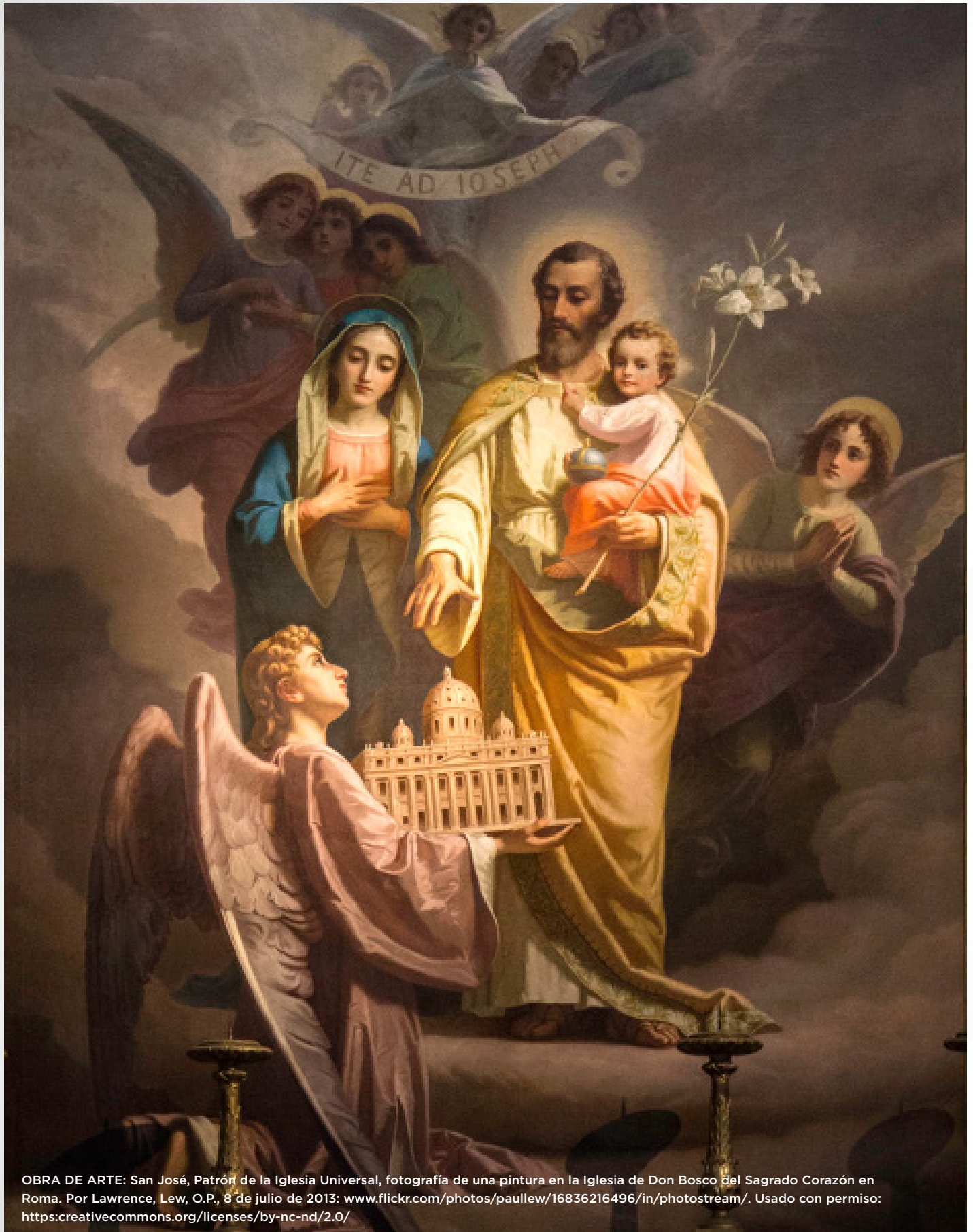
OBRA DE ARTE: San José, Patrón de la Iglesia Universal, fotografía de una pintura en la Iglesia de Don Bosco del Sagrado Corazón en Roma.