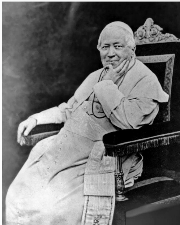
El Papa Pío IX. Autor desconocido. Este archivo multimedia está en dominio público en Estados Unidos. http://loc.gov/pictures/resource/cph.3b21214/

En 1961, al comienzo del Concilio Vaticano II, el Papa San Juan XXIII nombró a San José patrón del Concilio 20 y, al año siguiente, insertó el nombre de San José en el